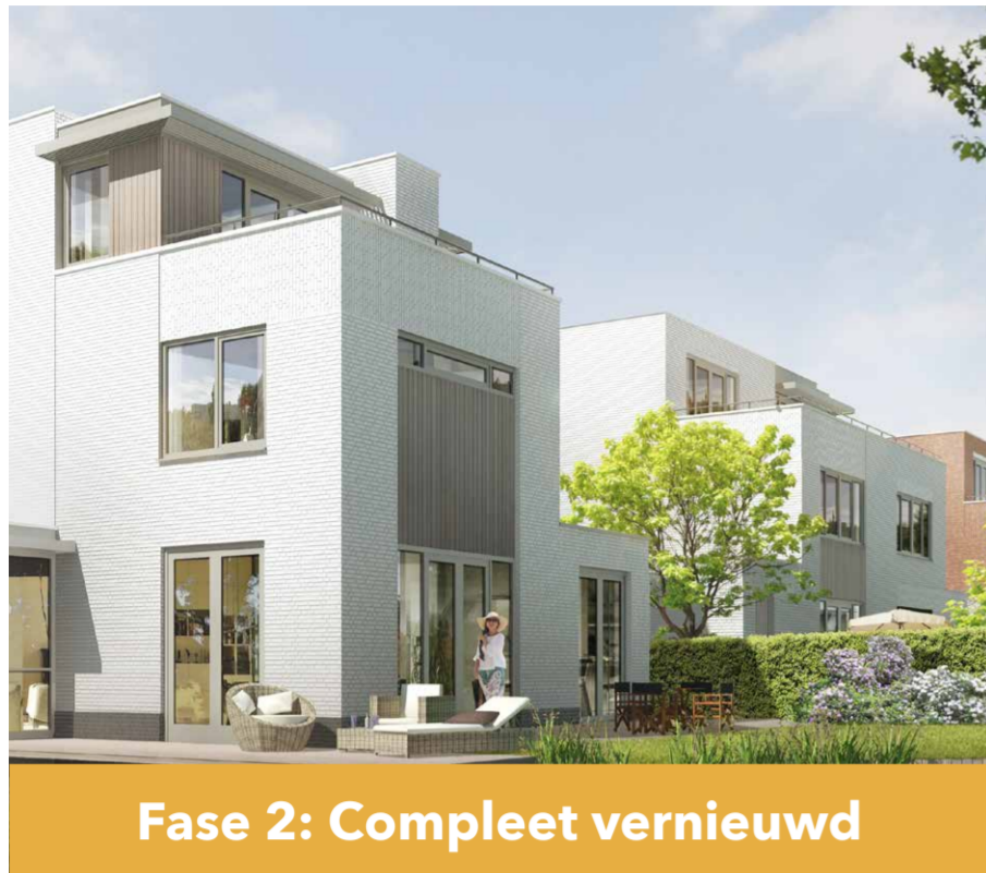
Fase 2: Compleet vernieuwd